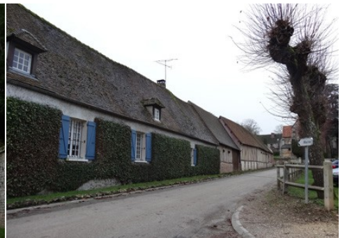
Photographies de l'existant